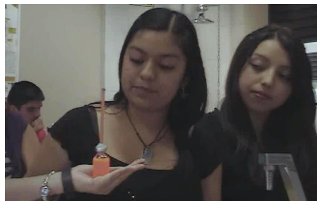
Figura 3. Elaboración de un termómetro.

Los estudiantes presentaron sus termómetros en clase y se les pidió que compartieran su experiencia con los demás compañeros. Además entregaron evidencia del trabajo desarrollado en un video.