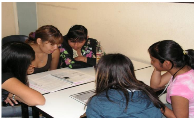
Figura 1. Grupo cooperativo en una sesión de trabajo.

En la implementación de cualquier actividad académica el maestro deberá explicar a los estudiantes de qué trata la tarea a desarrollar, cuál es la manera recomendable de realizarla, qué sentido tiene para su aprendizaje del tema y cuál es el objetivo que se persigue.