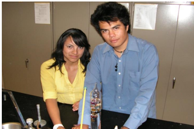
Figura 2. Distintos tipos de termómetros.

Para complementar esta actividad se mostraron algunos termómetros como el galileano, el de cristales líquidos, el de sensor infrarrojo y el de bulbo de mercurio.