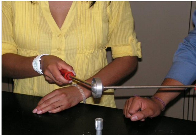
Figura 4. Dilatación de una esfera metálica.

fenómeno físico. Por ejemplo cuando queremos destapar un frasco de vidrio que tiene una tapa metálica ponemos la tapa al fuego y debido a que el metal tiene una mayor dilatación que el vidrio podemos destaparlo, o por qué existe una separación entre los rieles por los que pasan los trenes, así como por qué los dentistas usan un material de relleno para las muelas que se dilatan de igual forma que estas.