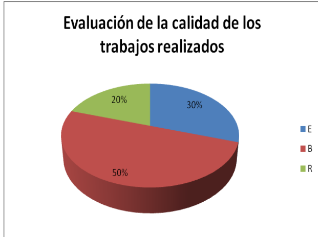
FIGURA 2. Evaluación de la calidad de los trabajos realizados. Se observa que el 80% de los trabajos presentados obtienen una evaluación de Excelente o Bien.

En relación con la calidad de los trabajos presentados se muestran los resultados de la evaluación en la Fig. 2.