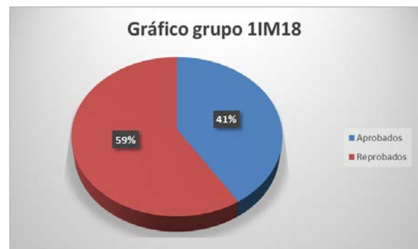
FIGURA 4. Gráfico porcentaje de aprobación grupo de control.

En tanto que con el grupo de control, se utilizaron otras actividades de aprendizaje que consistieron en la investigación de la temática, la realización de un crucigrama y un control de lecturas, ambos grupos realizaron el mismo tipo de evaluación y la misma escala que para el grupo experimental, el promedio fue: 5.1. Los porcentajes de aprovechamiento de dicha evaluación para este grupo fueron notoriamente menores, el porcentaje de aprobación fue del 41% (ver figura 4).